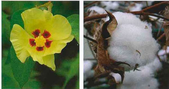
綿の花とコットンボール

綿はフヨウやハイビスカスと同じ葵（アオイ）科の植物で、美しい薄黄色の花を咲かせます。やがて花は紅色に変わり、数日で落下した後、子房が熟し、コットンボールと呼ばれる綿の実になります。