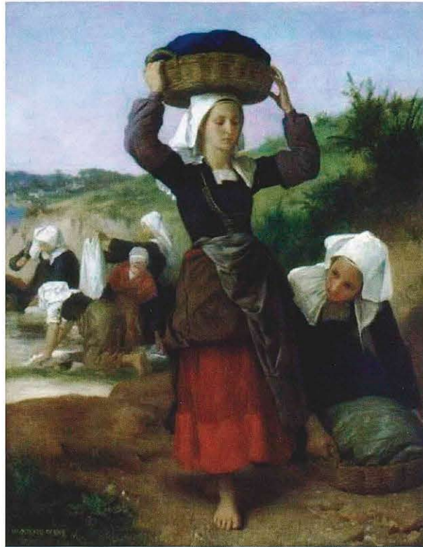
ウィリアム・アドルフ・ブーグロー (1869)

この絵は、ウィリアム・アドルフ・ブーグロー (1825-1905) の代表的な作品です。ブルターニュ地方にあるフェナンの農民の生活風景を描いています。中央の女性は洗いが終わった洗濯物のバスケットを頭に乘せており、他の人々は洗濯の様々な段階の作業をしています。細部にこだわった写実的な表現は新古典派といわれるもので、中央の女性はギリシャ神殿の装飾を支える彫像にインスピレーションを得て、当時のフランス農民の生活をリアルに描いたものといわれています。