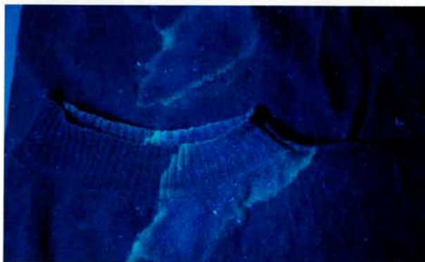
特殊な光線(紫外線)で衣類の汗成分が浮かび上がる 一般的に、吸水性の高い素材に汗が集中します。

綿、絹、麻、レーヨン、ウールなどの素材は、生地構造の深くまで汗成分が浸透することになります。クリーニングに依頼される繊維製品のほとんどは外着です。このことから、下着によって汗が吸収されない部位に集中的するといえます。上着であれば、襟周り、脇の下、袖口、スラックスでは太もも前部分にということになります。