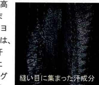
縫い目に集まった汗成分

綿、絹、麻、レーヨン、ウールなどの素材は、生地構造の深くまで汗成分が浸透することになります。クリーニングに依頼される繊維製品のほとんどは外着です。このことから、下着によって汗が吸収されない部位に集中的するといえます。上着であれば、襟周り、脇の下、袖口、スラックスでは太もも前部分にということになります。