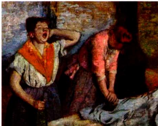
エドガー・ドガ作 (1884年) 部分

19世紀のフランスの画家であるエドガー・ドガは、パリ・オペラ座のバレダンサーを描いたパステル画などで知られています。ドガは裕福な銀行家の家に生まれた人ですが、当時のパリの日常生活の中で女性たちの表情を切り取った作品を多く描いています。華やかに見えるバレエであっても、舞台裏での幼い踊り子の緊張した表情や疲れた姿の一瞬をとらえています。