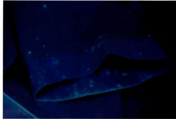
綿のコートに発生しているカビ(紫外線照射写真)

カビは、栄養になる綿繊維などの植物系繊維に繁殖しやすく、繊維を酵素を出して分解し、養分として吸収して成長します。