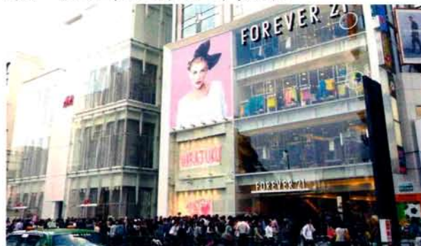
原宿にオープンした外資系ファストファッション店に集まる人

平成20年にはリーマンショックが起こりました。その頃から、H&Mやユニクロに代表されるファストファッションがブームになり、低価格ファッションが拡大しました。