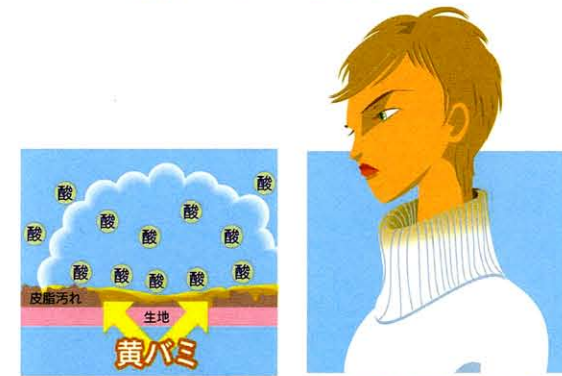
生地表面の皮脂汚れが、酸素と結合し黄バミます 首周りが黄色く変色したセーター