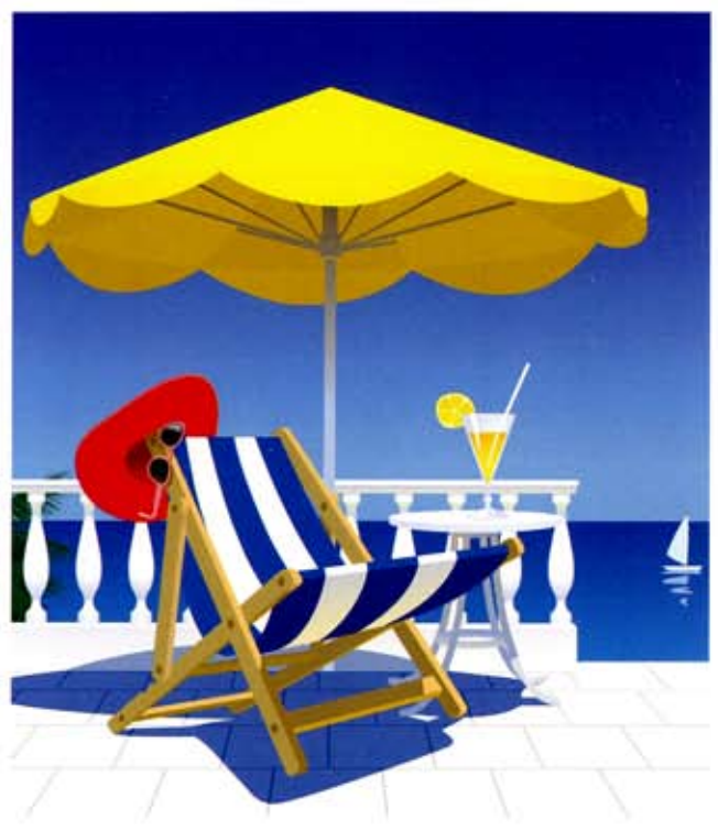
ファッション・ワンポイント: おしゃれで粋な夏の帽子 衣類のパーツの名称: ワイシャツ 繊維物語: ナイロン誕生秘話-日本製品不買運動とストックキング 衣生活の知恵: なぜ着ているだけで衣類が汚れるのか?