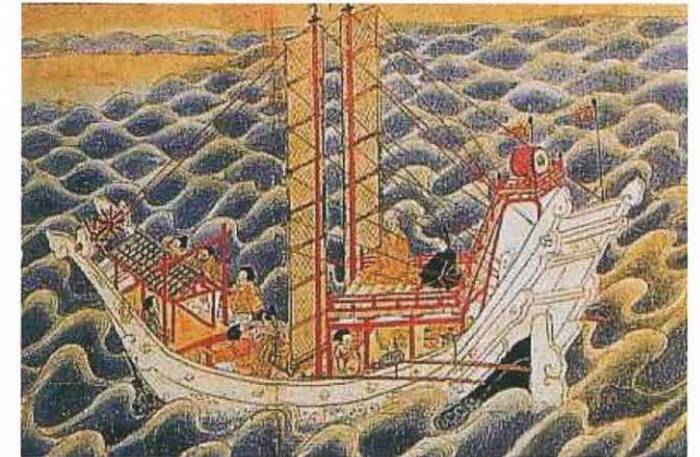
竹の帆の遣唐使船図(図説和船史話より)

それ以前には、綿布というものが無かつたので、帆船の帆もいわゆる帆布では無かつたわけで、遣唐使船の帆として使われていたのは竹を網代に編んで作られたものを帆として使っていたということです。