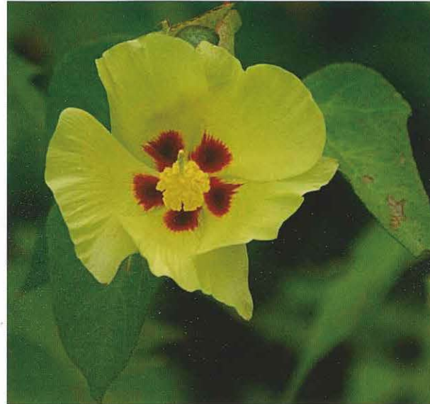
熱帯の植物である綿の花はハイビスカスの仲間

が原産地とされています。ですから、ヨーロッパの人々は、綿という植物を知らず、17世紀初頭に設立された東インド会社によって、初めて大量の綿繊維がヨーロッパに輸入されるようになり、その後、産業革命による大規模な綿紡績工場が稼働するようになり、徐々に普及していったというわけです。そして、今では全繊維生産量の半数近くを占めるようになりました。