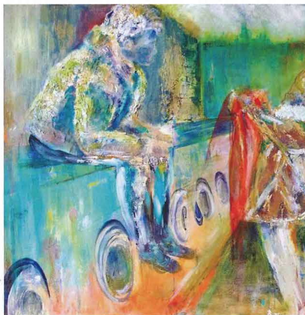
イザベル・レイガーツ (2020年)

ベルギーのイザベル・レイガーツは、彼女の目に映る日常の人々を描く現代画家です。特に身の周りの人の自然な表情を写し取ります。